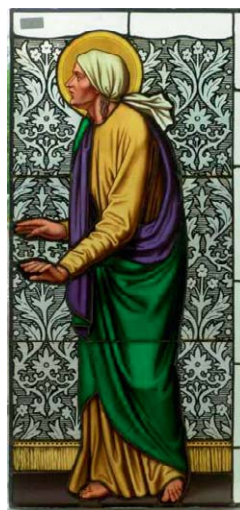
Glasbild 19. Jahrhundert 47 x 98 cm