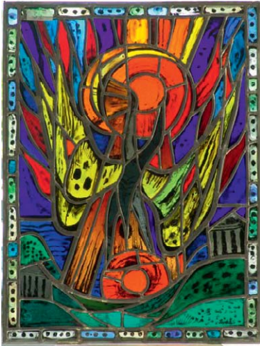
Albert Birkle Ikarus, 52 x 71 cm