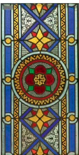
Ornament 20. Jahrhundert, 40 x 78 cm