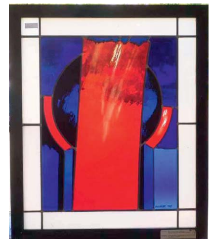
Otto Herbert Hajek 80 x 95 cm