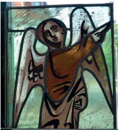
Wilhelm Geyer Engel, 48 x 42 cm