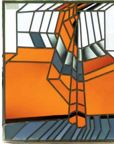
Diether Domes 41 x 46 cm