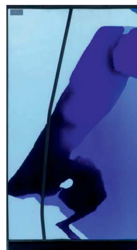
Tobias Kammerer 49 x 90 cm