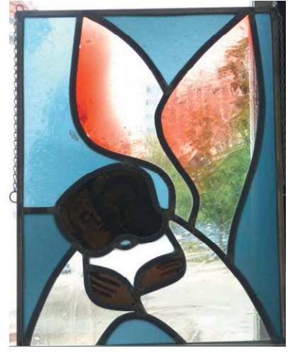
Hermann Geyer Engel, 30 x 40 cm